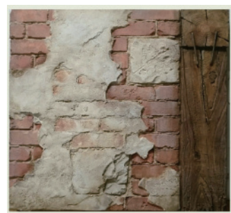
レンガ&プラスター&木